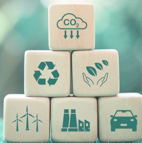
Schéma de Promotion des Achats publics Socialement et Ecologiquement Responsables