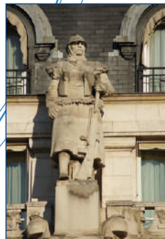
Photographies : Nicolas Janberg https://structurae.info/ouvrages/cercle-national-des-armees