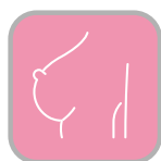
CANCERS DU SEIN

Nouvelle programmation du mardi 23 au vendredi 26 janvier 2024 pour bénéficier pleinement de ces journées d'échanges dans les aires thérapeutiques suivantes: