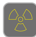
RADIOTHÉRAPIE & IMAGERIE MÉDICALE