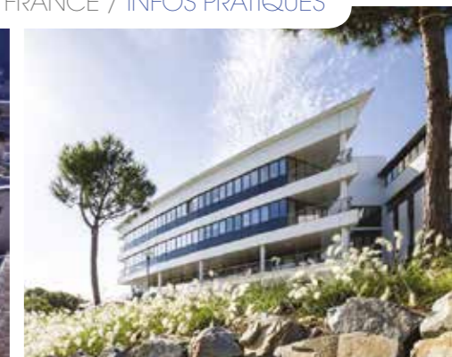
De gauche à droite : CHU d'Amiens – Centre Antoine Lacassagne, Centre de lutte contre le cancer de Nice – Institut de Cancérologie de l'Ouest, Nantes