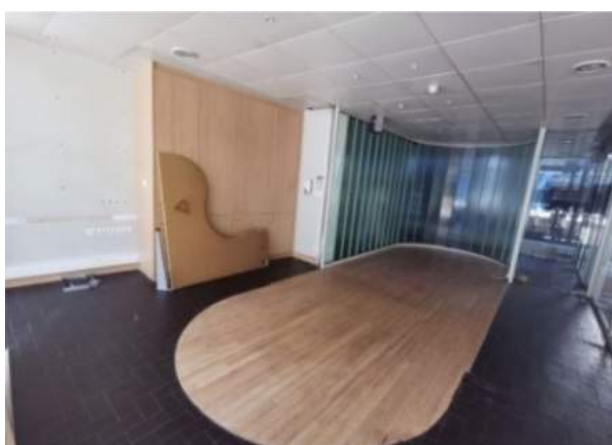
Vue de l'ERI avant réaménagement

L'idée de départ a été de prendre soin, de rendre moins austères les coursives, en travaillant les passages empruntés par les patients, accompagnants et soignants. Cet espace dédié au partage permet désormais un échange dans un espace moderne, convivial et ergonomique. Par un aménagement intérieur qui contribue à la façon dont on pense l'hospitalité aujourd'hui, c'est une invitation pour tous les acteurs à prendre place dans le débat.