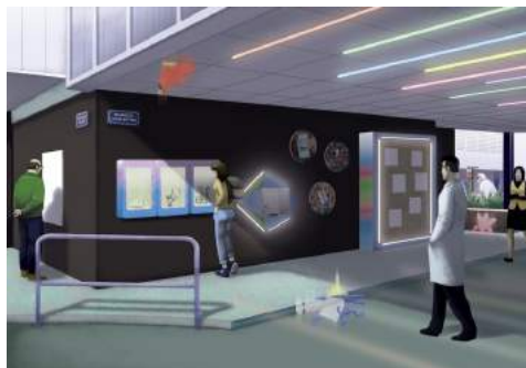
Arnaud Théval + Cancan Le passage du cœur battant (2020), esquisse. Illustration © Cyrille Beirnaert.