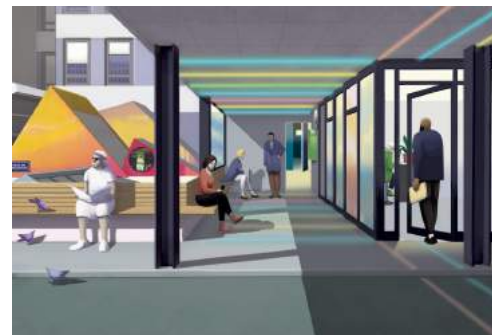
Arnaud Théval + Cancan La place de l'arc-en-ciel (2020), esquisse. Illustration © Cyrille Beirnaert.

En collaboration avec le collectif d'architectes Cancan, l'artiste a en effet proposé une création à partir de l'existant pour permettre notamment à l'ensemble des publics de s'orienter lors du parcours de soins. L'œuvre globale «Le chemin de sa personne» est une composition spatiale et symbolique réalisée à partir d'objets, de mots, de couleurs recueillis lors des rencontres de l'artiste avec les professionnels, les patients et les passants lors des P.P.P (performances poétiques et politiques) menées dans le cadre de sa résidence « Blanc maquillage » initiée en 2017. Les impressions perçues ont dialogué avec les imaginaires partagés, pour ensuite émerger plastiquement dans l'espace public de l'institut Bergonié ; et aussi dans l'ouvrage « Hôpital cherche Nord ».