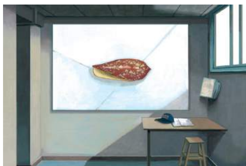
Arnaud Théval + Cancan Le sablier inversé (2020), esquisse. Illustration © Cyrille Beirnaert.

collaboration art-institution, inédit dans le milieu hospitalier, est de générer dans l'ensemble de ces espaces d'accueil et de passage une atmosphère chaleureuse et familière. Pensés par Arnaud Théval dans l'esprit de « places du village », ils apporteront paix et convivialité, tout en étant des repères de cheminement sur site.