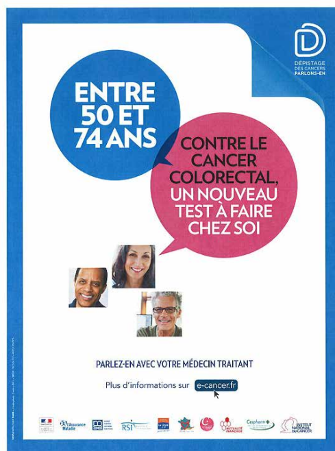
Campagne de l'Institut national du cancer (INCa) pour Mars bleu 2016